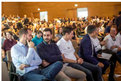
Bilder vom 1. SDG Jugendgipfel 2019 in Heilbronn, Bildungscampus