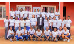
Queens Model School, Nigeria