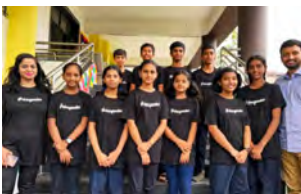
CSME Kawarsadi, Indien

Die Schulen werden sich auf dem 2. SDG-Jugendgipfel präsentieren und ihre Ideen vorstellen. Der Austausch und die Zusammenarbeit zwischen den verschiedenen Schulen und Kulturen sind von unschätzbarem Wert und tragen dazu bei, eine nachhaltigere Welt zu schaffen.