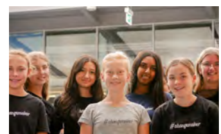
FvAG, Bad Friedrichshall