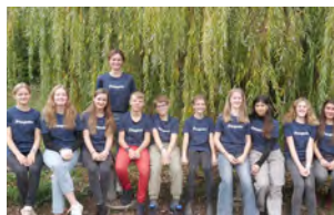
Entental Gymnasium, Bietigheim